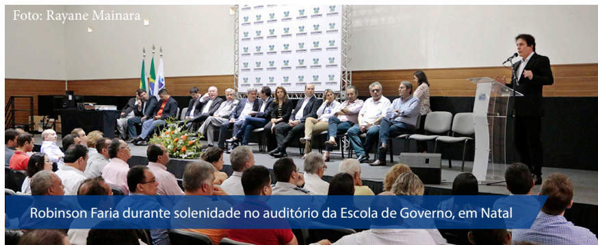
Robinson Faria durante solenidade no auditório da Escola de Governo, em Natal

ção, acondicionamento e transporte adequado, o que contribui para a emancipação das famílias produtoras”. O PAA é realizado em parceria com o Governo Federal, através do Ministério do Desenvolvimento Social e Agrário – MDS, que também apoia outras iniciativas como os programas Primeira Água e Segunda Água, construção e recuperação de reservatórios de água, perfuração de poços tubulares, carros pipa e a instalação de barragens submersas que já