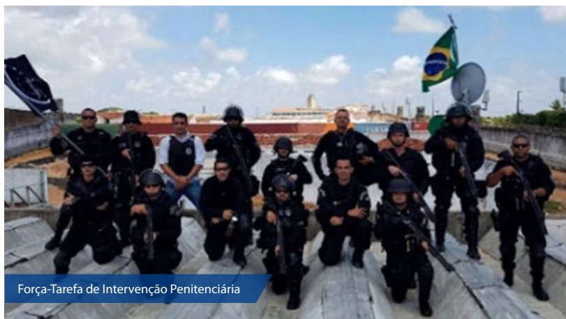
Força-Tarefa de Intervenção Penitenciária

O Ministério da Justiça e Segurança Pública prorrogou por mais 90 dias a permanência da Força-Tarefa de Intervenção Penitenciária no Rio Grande do Norte.