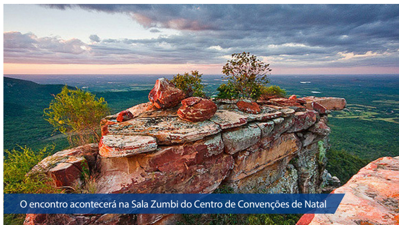
O encontro acontecerá na Sala Zumbi do Centro de Convenções de Natal

Uma das principais ações voltadas ao turismo potiguar dos últimos anos será apresentada em primeira mão hoje (27) durante a 62ª reunião do Conselho Estadual do Turismo (Conetur/RN). O encontro acontecerá na Sala Zumbi do Centro de Convenções de Natal, a partir das 9h. A reunião é aberta à imprensa.