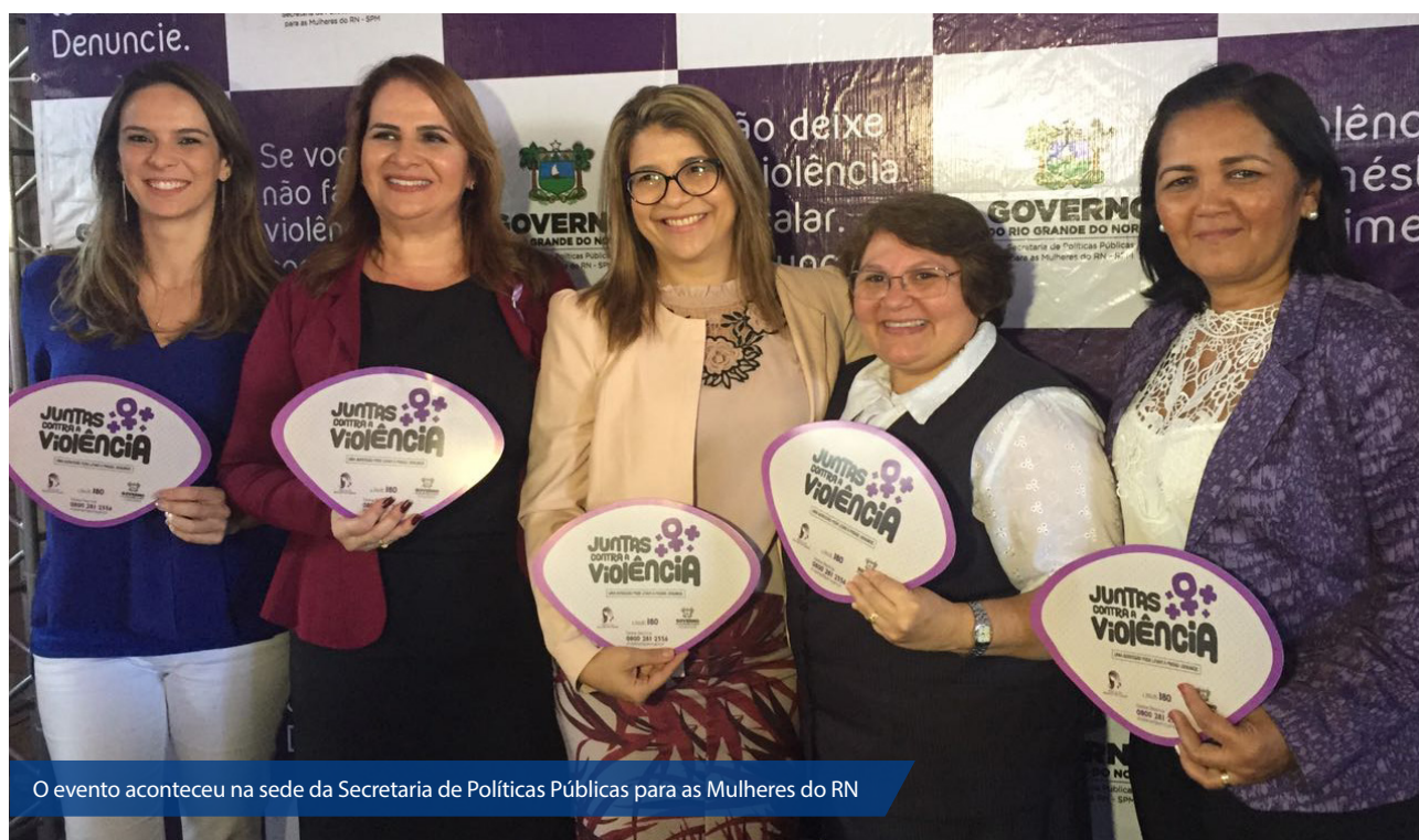
O evento aconteceu na sede da Secretaria de Políticas Públicas para as Mulheres do RN

Durante 30 dias serão desenvolvidas ações diversas para conscientizar a população sobre violência doméstica e direitos da mulher