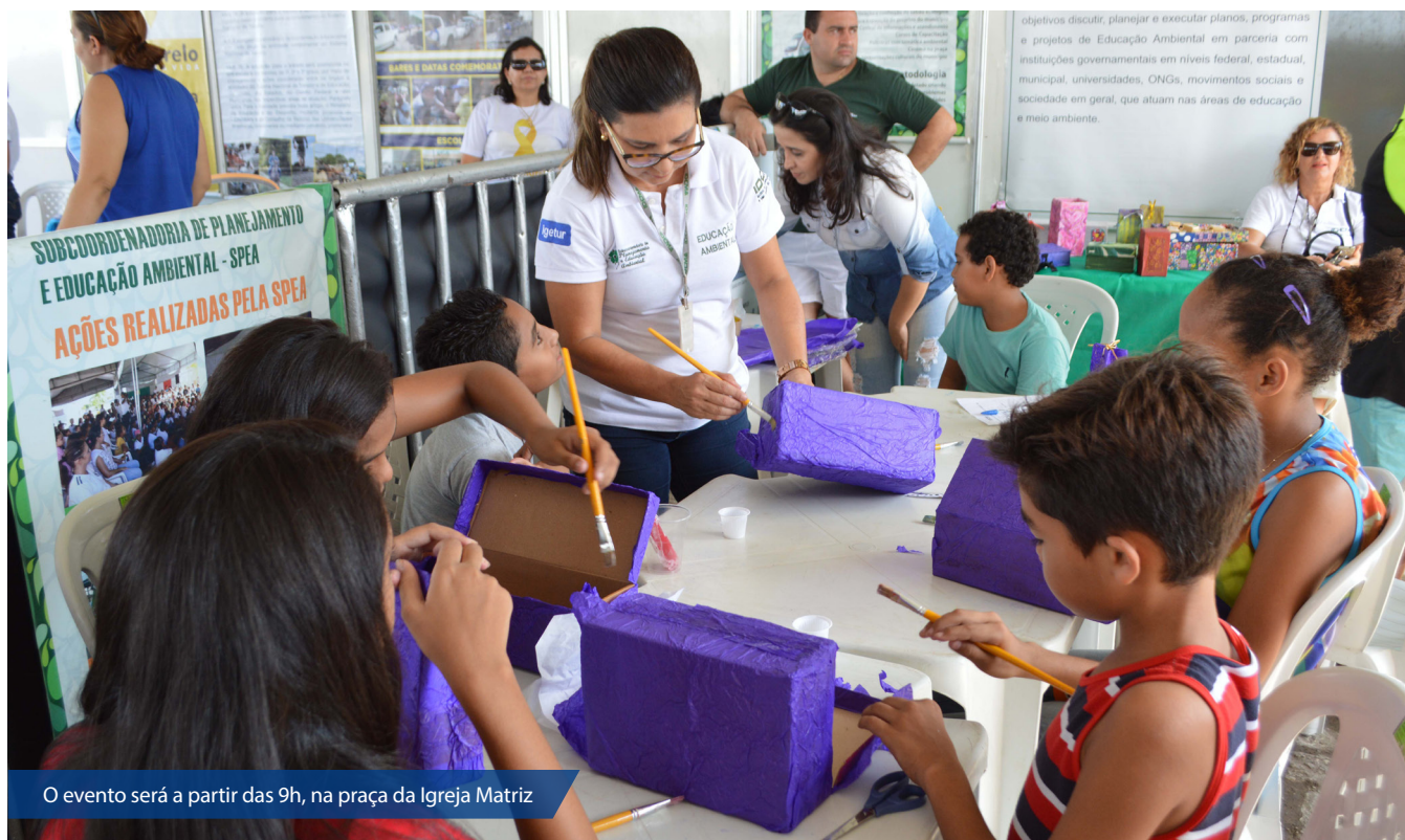
O evento será a partir das 9h, na praça da Igreja Matriz

A 18ª edição do projeto Vila Cidadã será amanhã (28), no município de Baraúna, região Oeste. O evento será a partir das 9h, na praça da Igreja Matriz e levará para a população os serviços públicos oferecidos pelo Estado, além de oferecer um dia de lazer, educação, cidadania e cultura. Já foram contabilizados cerca de 38 mil atendimentos nas 17 edições, que foram realizadas em cinco bairros de Natal e 12 municípios.